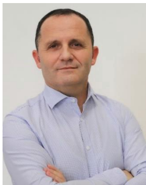
DR. FAIK HOTI

NATIONAL INSTITUTE OF PUBLIC HEALTH OF KOSOVO